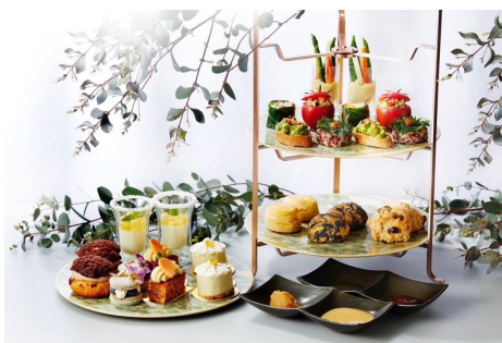
シャングリ・ラ 東京「ウェルネスサマーアフターヌーンティー」