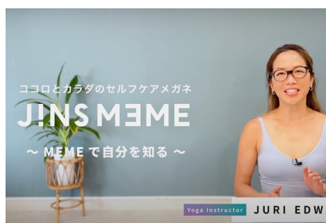
JINSセルフケアメガネ